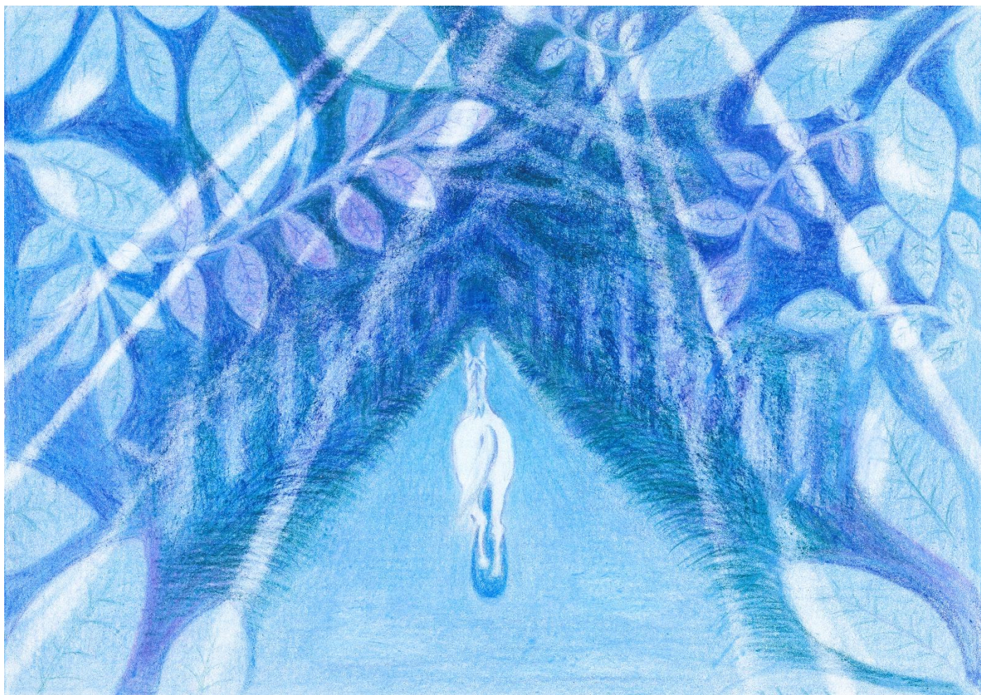
Paralym Art 「青い旅立ち」アキ 作

株式会社アパックス・インターナショナル 東京都台東区上野 5-19-4 美鈴ビル 8F TEL: 03-5812-3053/FAX:03-5812-3054